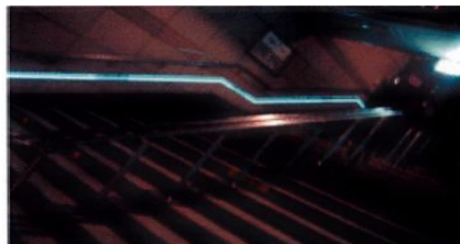
劇場ホールや施設内廊下・階段の誘導表示