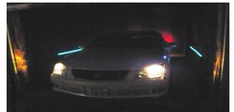
カー用品や設備への応用等