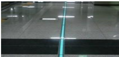
地下道コンコース誘導経路表示