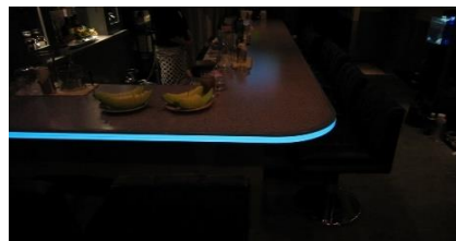
スナック等飲食店装飾