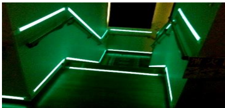
介護施設等の誘導標識