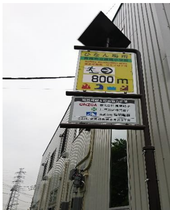
新基準対応型避難誘導標識