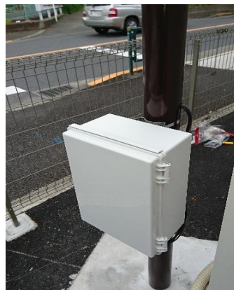
新型全自動制御装置