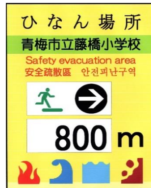
標識表示内容 (4か国語対応)